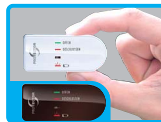
FENSTER SENDERGEHÄUSE ZUSÄTZLICH IN BRAUN BEIGEFÜGT